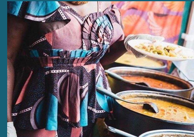
Vegetarisch, vegan möglich