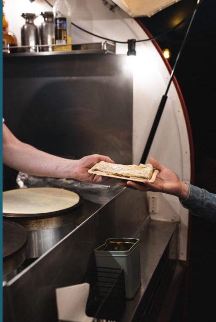
Süße und salzige Crepes